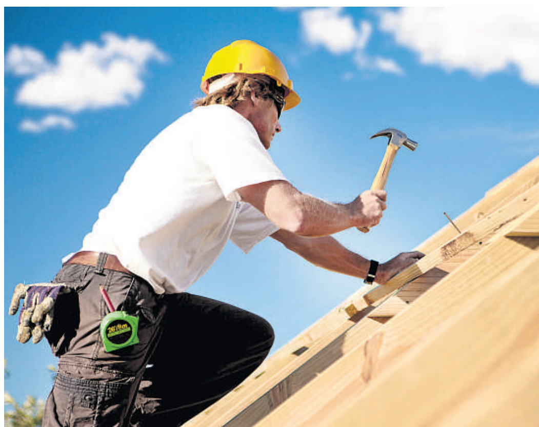
Hamburgs Handwerker freuen sich über eine starke Auftragslage und Konjunktur.

Für das Sommerhalbjahr (April bis September 2017) erwarten der Umfrage zufolge 33 Prozent der Betriebe eine weitere Verbesserung der Geschäfte, 55 Prozent erwarten gleichbleibend gute Geschäfte, zwölf Prozent rechnen mit Rückgängen. Die positive Entwicklung wirkt sich auch auf