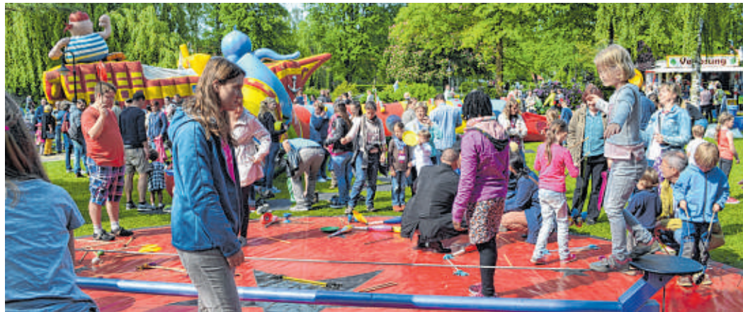
Balancieren, springen, spielen - und Musik gibt es auch beim Kinderfest im Kurpark.