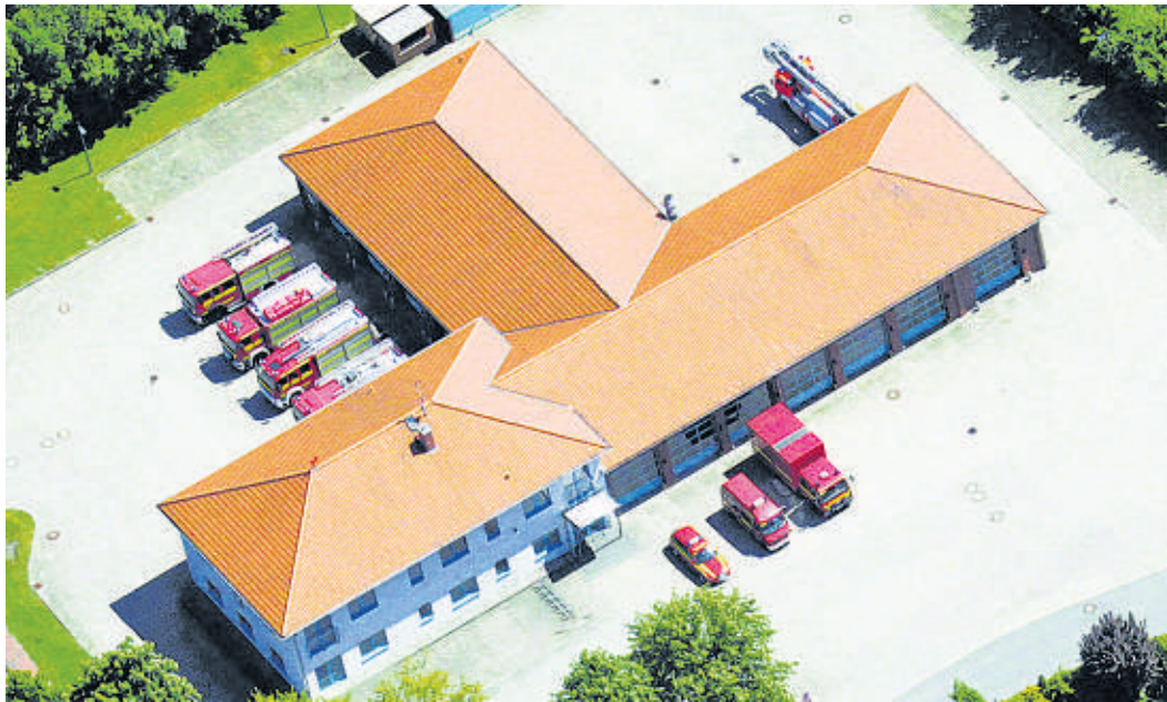
Die Feuerwache an der Lauenburger Straße 46 platzt aus allen Nähten: Ob jedoch eine Erweiterung am Standort möglich ist, müssen jetzt die Experten klären.

Gerätewart, nicht Hausmeister „Wir versuchen seit Jahren, den hauptamtlichen Gerätewart vom Tätigkeitsfeld ‚Hausmeister‘ zu entbinden“, sagt hingegen Bettin: „Er hat mit den anfallenden Arbeiten, die unsere Ausrüstung und die jährlich etwa 200 Einsätze mit sich bringen, genug zu tun.“ Zudem: Schneidet der Gerätewart die Büsche, kommt der Bauhof trotzdem noch, um den Grünschnitt abzufahren.