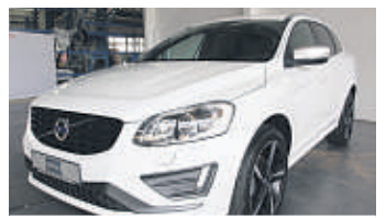
Dynamischer Auftritt: der Premium-SUV XC60 überzeugt.

Kraftstoffverbrauch XC60 D3 (in l/100 km): innerorts/außerorts/kombiniert: 4,5/4,2/4,9; CO 2 -Emission (g/km): kombiniert 117.