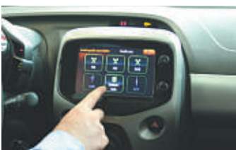
Das Sondermodell verfügt über viele tolle Features, wie einen Touchscreen-Monitor.