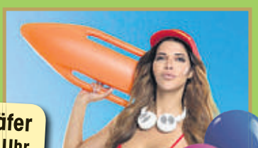
Micaela Schäfer Sonntag 16.00 Uhr

Gewinncoupon Ziehung Fr. 17.00 Uhr und So. 16.00 Uhr