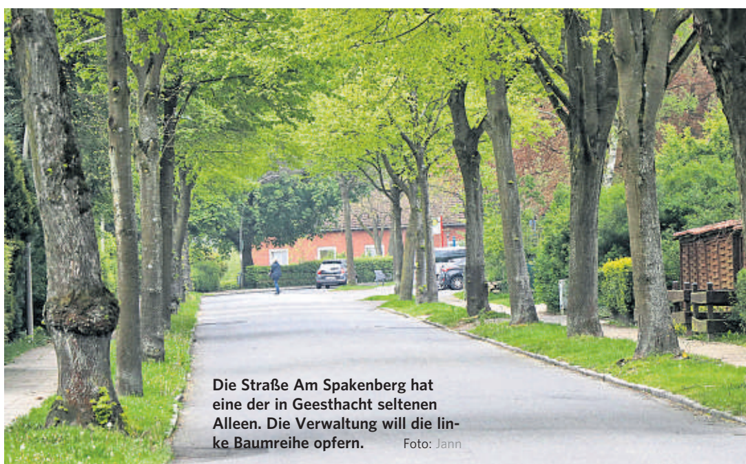
Die Straße Am Spakenberg hat eine der in Geesthacht seltenen Alleen. Die Verwaltung will die linke Baumreihe opfern.

Geesthacht (tja). Besitzer geschützter Bäume können aufatmen: Wenn sie künftig beispielsweise wegen Pilzbefalls einen Baum fällen müssen, der unter die Geesthachter Baumschutzsatzung fällt, sollen gelockerte Bestimmungen gelten. Künftig müssen Eigentümer bei Fällungen nur aufgrund besonderer Umstände, etwa wegen eines Bauvorhabens, für Ersatz sorgen. Die genaue Formulierung soll die Verwaltung erarbeiten.