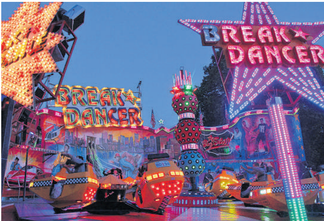
Premiere in Geesthacht: Der Jahrmarkt hat nun vier Tage lang geöffnet.

Weitere Untersuchungen sollen folgen, bis Herbst Ergebnisse vorliegen. Die bis zu 100 000 Euro teure Analyse bezahlen Kreis und Land jeweils zur Hälfte. Ob und, wenn ja, welche Variante umgesetzt wird, entscheidet die Politik. „Einhellige Meinung ist, dass das Busangebot von Geesthacht nach Bergedorf nicht schlecht ist“, betont der Ministeriumssprecher, dass kein Schnellschuss geplant sei.