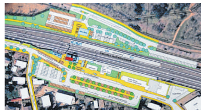
So könnte Schwarzenbeks neuer Bahnhof aussehen.

Erstmals hatten die Planer um Roland Neumann ihre Visionen im Februar im Haupt- und Planungsausschuss vorgestellt. Aus der Diskussion mit den Politikern über jeweils drei mögliche Varianten für die Nord- und Südseite haben die Planer ein mögliches Gesamtkonzept entwickelt und im Forum des Gymnasiums der Öffentlichkeit vorgestellt. Aktuell gibt es auf der Nordseite 150 Parkplätze, im Süden sind es 170. Hinzu kommen 234 Fahrradstellplätze, die kaum überdacht sind und die Neumann als „überaus rustikal“ bezeichnete. Nach sei-