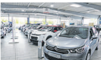
Bei Citroën-Krüll in Bergedorf gibt es die flotten Fahrzeuge aus Frankreich.