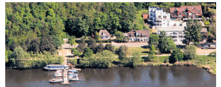
19 Schiffe können an der Steganlage der Wassersportgemeinschaft Grünhof-Tesperhude festmachen.

Auf Bitten von Rüdiger Tonn (FDP) wird die Stadtverwaltung mit der Unteren Naturschutzbehörde sprechen, aber die Verantwortlichen sehen kaum Chancen für die Wünsche der WGT.