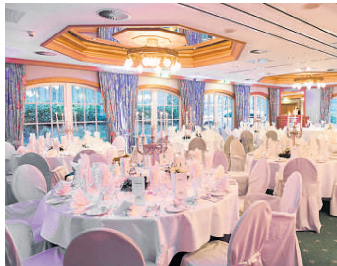
Ein festlich dekorierte Saal, dazu eine Terrasse zum Verweilen auch unter freiem Himmel – so stilvoll (und sorgenfrei) lässt sich im Waldhaus Reinbek Geburtstag feiern.

Vorbestellungen werden unter Tel. 040/727 52 0 entgegengenommen.