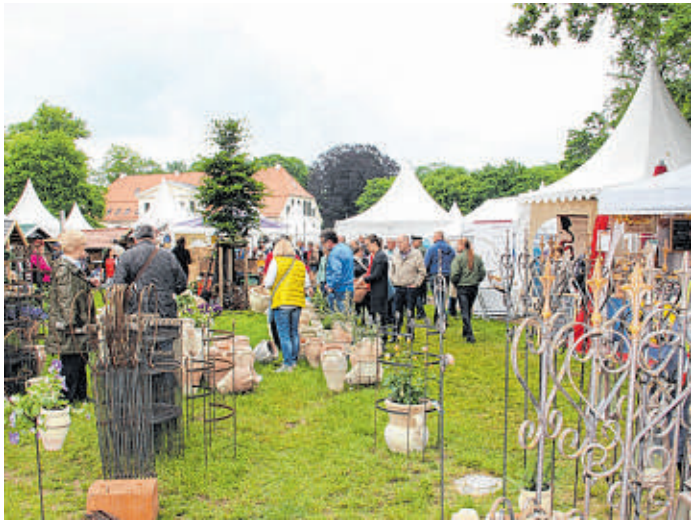
Auf dem Landgestüt Redefin, zwischen der Elbe und Hagenow an der B5 gelegen, wiederholt sich vom 25. bis 28. Mai die LebensArt-Messe mit 200 Ausstellern.