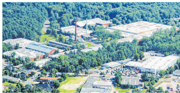
Das 24 Hektar große Areal der alten Teppichfabrik aus der Luft. Was hier jetzt entstehen soll, wird rege diskutiert.

Eine Anmeldung für die Abendveranstaltung ist nicht erforderlich. Klimaschutzmanager Hapke ist erreichbar unter 04104/990 423 oder per Mail an j.hapke@amt-hohe-elbgeest.de .