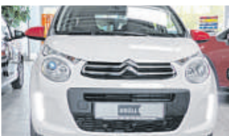
Sein vertikal angelegtes Design ist verführerisch und lässt den Citroën C1 geradezu lächeln.