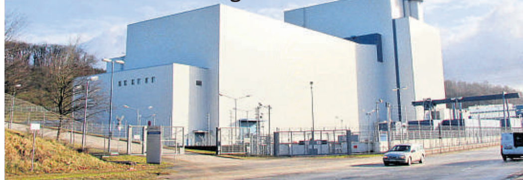
Der Reaktor des Atomkraftwerks Krümmel steht seit 2007 fast ununterbrochen still. Beim Rückbau der Anlage werden in den kommenden Jahrzehnten etwa 500 000 Tonnen Abfall (97 Prozent der Gesamtmasse) anfallen, die nach dem sogenannten „Freimessen“ als normaler Abfall entsorgt werden können.

Vattenfall Regionale Firmen werden beim Rückbau des Atomkraftwerks Krümmel nicht bevorzugt