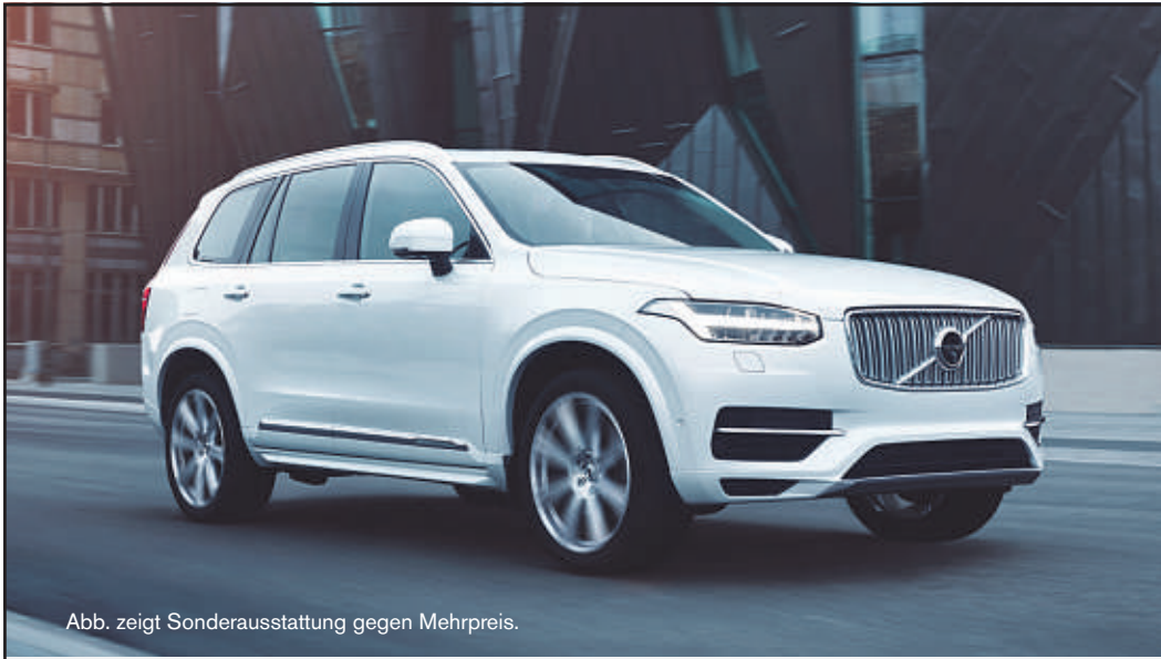
Abb. zeigt Sonderausstattung gegen Mehrpreis.