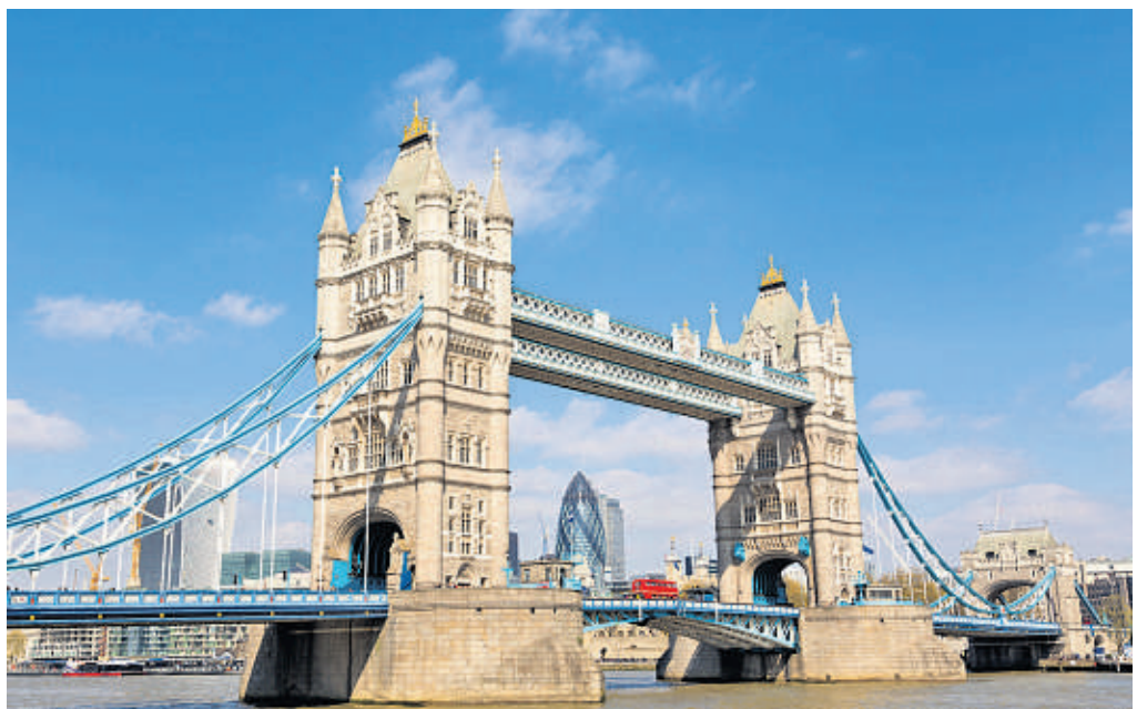
Wenn die MS Astor in London anlegt, bleibt Ihnen genügend Zeit für die Sehenswürdigkeiten wie die berühmte Tower Bridge.

Nähere Informationen und Buchungen im Reisebüro Rauter, bz-Leserreisen, Sachsentor 3, Bergedorf, Tel. 040/724 16 146. Weitere Reisetipps gibt's auf: bergedorfer-zeitung.de/leserreisen