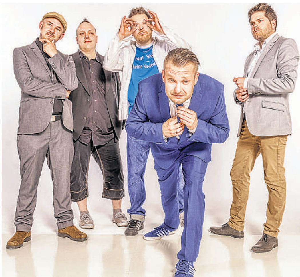
Sie sind wieder da: Bei den Hamburger Schnodder-Rockern Maggers United wechseln sich intime Momente und Parolen ab. Freud und Leid, Trauer und Feier liegen dicht beieinander.

Wo gibt es heute noch irgendetwas umsonst? Brillenträger wissen es: beim Optiker. Das Gestell drückt auf der Nase? Die Gläser sind verschmiert? Kein Problem: Der Optiker hilft schnell und unbürokratisch. Egal, ob das Teil bei ihm gekauft wurde oder bei der Konkurrenz. Das ist schon ein super Service in einer Zeit, in der jeder Handschlag Geld kostet. Danke, Optiker! Bleibt so hilfsbereit wie ihr seid! fra