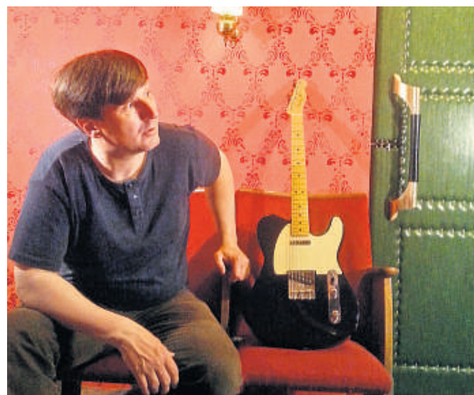
Beim Lieder-Lotto bestimmen die Zuschauer die Musikauswahl und dürfen sogar mitsingen.

Der ganz besondere Reiz beim Lieder-Lotto: Nicht die Musiker entscheiden, was ge-