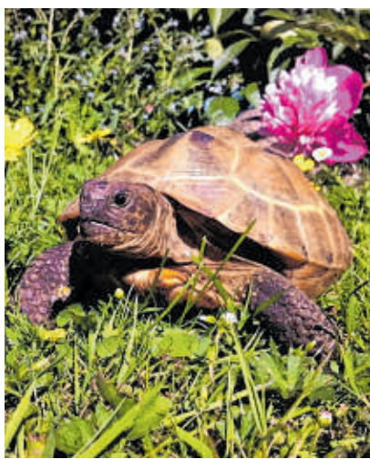
Schildkröte Beni unterwegs auf der Gartenwiese.