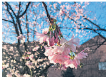
Vorsorge sichert eine würdevolle Bestattung

Nun stellt sich die Frage: Wie und bei wem lege ich im Rahmen der Vorsorge mein Geld an? Macht das überhaupt Sinn in Zeiten, in denen Bargeldeinlagen gerade einmal ein Prozent Zinsen bringen? Es gibt tatsächlich Bestattungshäuser, die ein Sparbuch anbieten, das fast keine Zinsen bringt. Zwar sind in deren Vorsorgeverträgen die Bestattungswünsche des Kunden festgelegt, aber die Preissteigerung, die im Bestattungsgewerbe in der Vergangenheit bei 2 Prozent pro Jahr lag, können sie natürlich nicht auffangen. Für die Sparbuch-Vorsorge bedeutet das: Der Kunde muss die über die Jahre gestiegenen Preise nachzahlen, damit die vereinbarte Leistung erbracht werden kann.