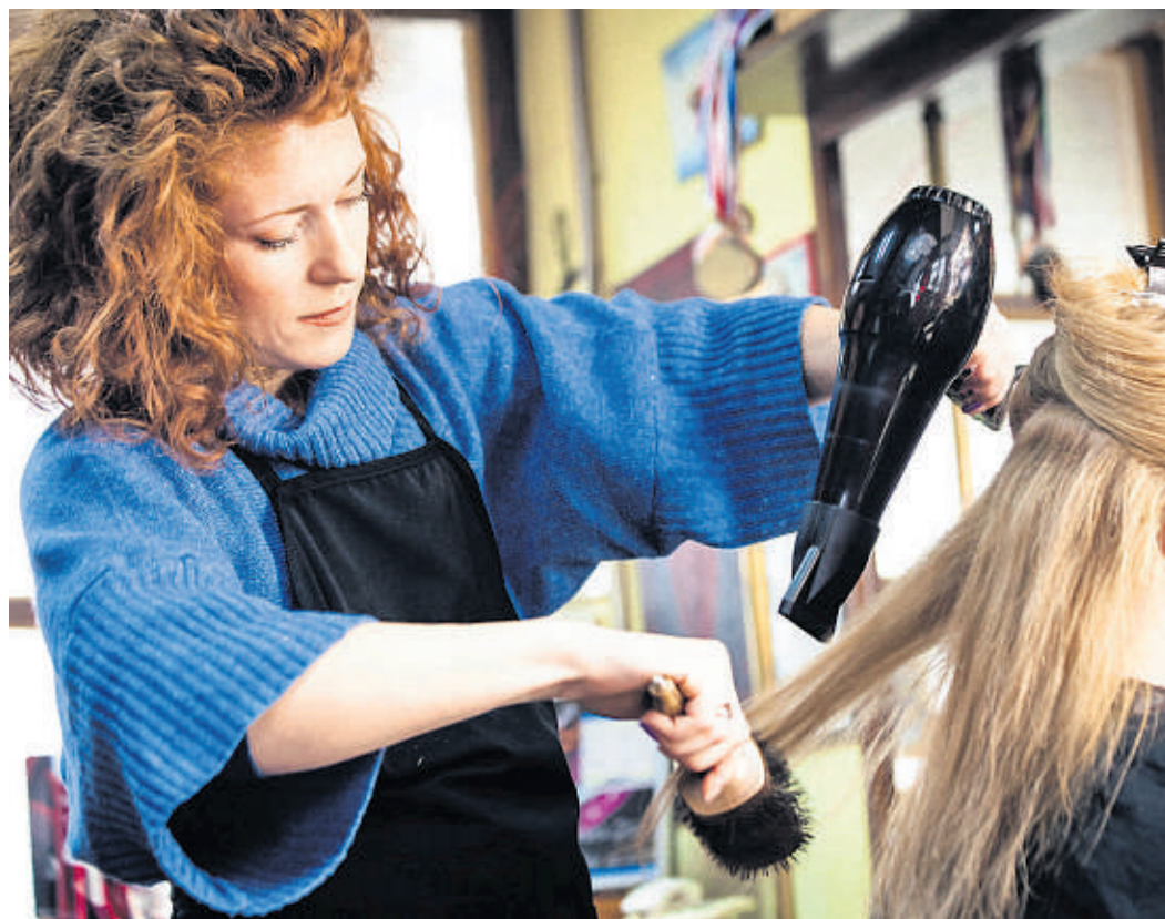
Frisörinnen und Frisöre verdienen im Schnitt nur 15 800 Euro brutto im Jahr (1317 Euro im Monat) und damit so wenig wie kaum eine andere Berufsgruppe mit anerkanntem Ausbildungsweg. Zu den schlechtbezahltesten Berufen in Deutschland zählen außerdem Verkäufer/-in oder Koch/Köchin (jeweils 1470 bis 1800 Euro brutto im Monat). Auffällig: Doppelt so viele Frauen wie Männer müssen mit einem geringen Lohn auskommen.

Das zeigt eine neue Studie des Deutschen Gewerkschaftsbunds. Danach verdienen bundesweit 20,9 Prozent aller Beschäftigten mit einem anerkannten Ausbildungsabschluss weniger als 10 Euro brutto in der Stunde. Besonders hoch ist die Quote im Osten: Hier arbeiten 38,8 Prozent der Beschäftigten mit Berufsausbildung für einen Niedriglohn. Ein Grund dafür sei die fehlende Tarifbindung vieler ostdeutscher Unternehmen, so der DGB. Diese Zahlen stützt auch eine Untersuchung der Bundesregierung für das Jahr 2014. Demnach haben in dem Jahr rund 7,65 Millionen Be-