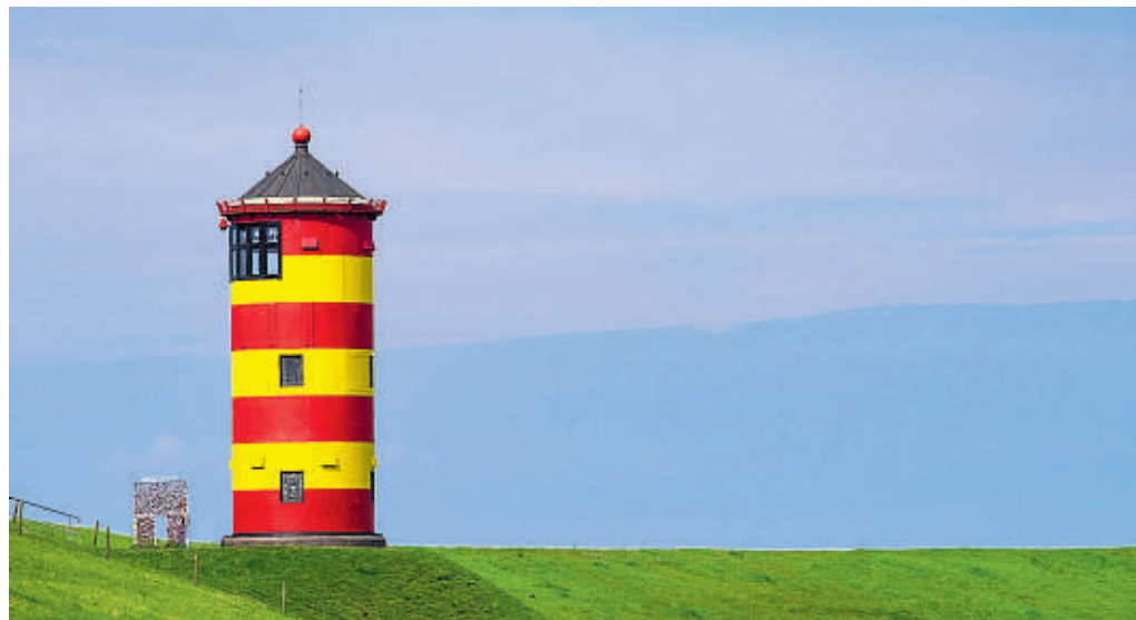
Der Leuchtturm von Pilsum in der Gemeinde Krummhörn.

Nähere Informationen und Buchungen im Reisebüro Rauter, bz-Leserreisen, Sachsen- tor 3, Bergedorf, Tel. 040/724 16 146. Weitere Reisetipps gibt's auf: bergedorfer-zeitung.de/leserreisen