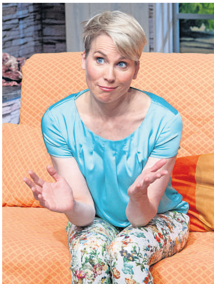
Romy (Birte Kretschmer) sucht sich für ihren heimlichen „Freistoß“ ausgerechnet den Mann ihrer Freundin aus.

Bis zum Abpfiff geraten beide „Mannschaften“ gehörig durcheinander und Kumpel Robbi macht als Schiedsrichter auch nicht die glücklichste Figur.