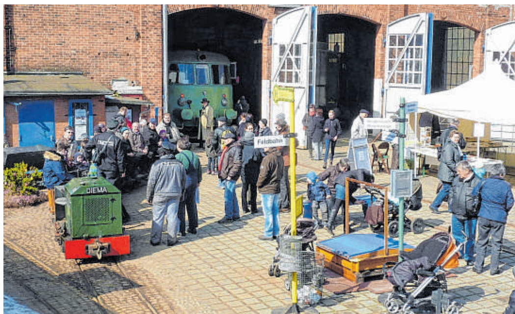
Am Ostermontag ist wieder großer Aktionstag von 11 bis 17 Uhr im Eisenbahnmuseum Lohbrügge Aumühle

Aumühle (fra). Der Ostermontag ist traditionell Lokschnuppen-Ausflugstag. Und auch in diesem Jahr laden die Hobby-Eisenbahner Groß und Klein zum zweiten großen Aktionstag der Saison 2017 am Ostermontag – am 17. April – herzlich ein. Den Besuchern wird das beliebte und kurzweilige Programm geboten: Historische Lokomotiven und Waggon zum Anschauen, Anfasen und Hineinklettern. Kleine Mitfahrten mit der Feldbahn und der Handhebelraisine. Führungen zur Eisenbahngeschichte und zur Funktionsweise einer Dampflok, Mo-