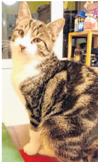
Kater Findus wurde zuletzt in der Chrysanderstraße gesehen.