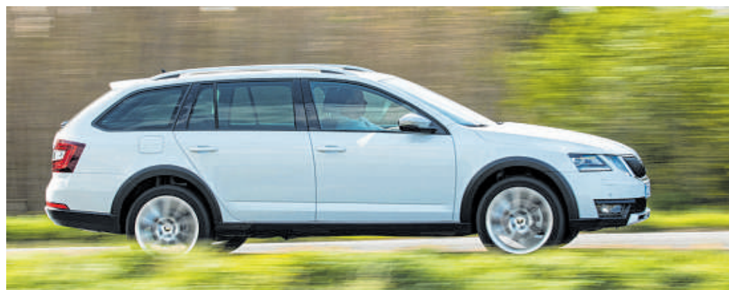
Stilsichere Proportionen, eine hohe Präzision bis ins kleinste Detail und ein überlegenes Platzangebot sind beim Škoda Octavia Combi garantiert.

Das Gepäckraumvolumen des Combi liegt bei 610 Liter, das sich (bei umgeklappter Rückbanklehne) auf bis zu 1740 Liter erweitern lässt. Komplettiert wird die Aufwertung der Kompaktklasse-Modelle durch zusätzliche „Simply Clever“-Lösungen.