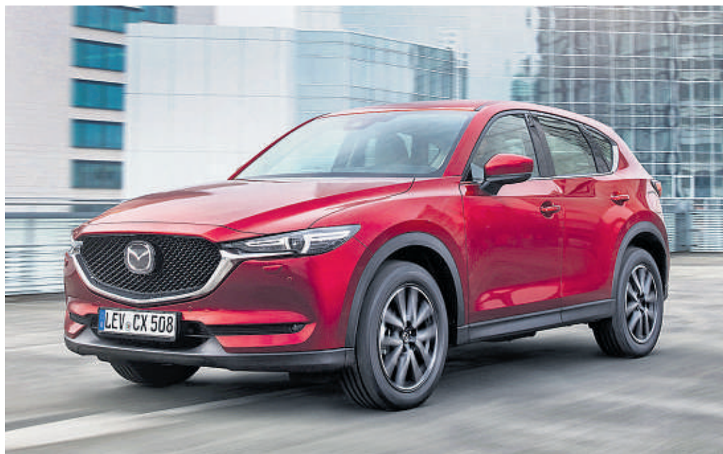
In der Sonderlackierung „Magmarot Metallic“ kommt das elegante Kodo-Design des neuen Mazda CX-5 besonders gut zur Geltung.

Im Interieur verbindet der neue Mazda CX-5 eine hochwertige Qualitätsanmutung mit durchdachter Ergonomie und optimierten Anzeigen. Alle wichtigen Instrumente und