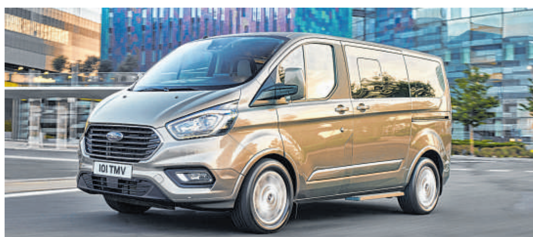
Morgens die Mitarbeiter zur Baustelle bringen, mittags die Sitze zum Warentransport umklappen bzw. entfernen und am Wochenende einen Ausflug mit Freunden unternehmen: Der Ford Transit Custom Kombi bietet eine außerordentliche Vielseitigkeit für Arbeitsalltag und Freizeit.

Der Innenraum bietet dem Fahrer viel Komfort dank der zahlreichen cleveren Stau-