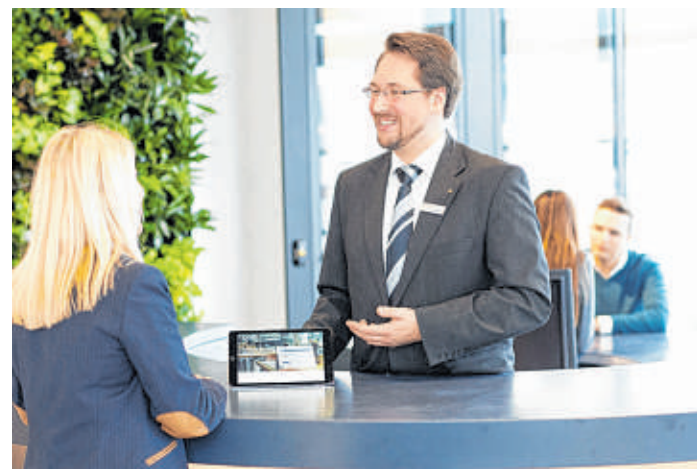
Während das Onlinebanking wächst, wird der direkte Kontakt mit Bankberatern immer seltener.

Statistisch gesehen besucht jeder Sparkassen-Kunde heute einmal im Jahr eine Filiale, nutzt die Angebote im gleichen Zeitraum aber mehr als 100 Mal über die App. „Deswegen werden wir die digitalen Zugangswege weiter ausbauen, ohne die Präsenz in der Fläche aufzugeben“, erklärte der Sprecher. Kooperationen