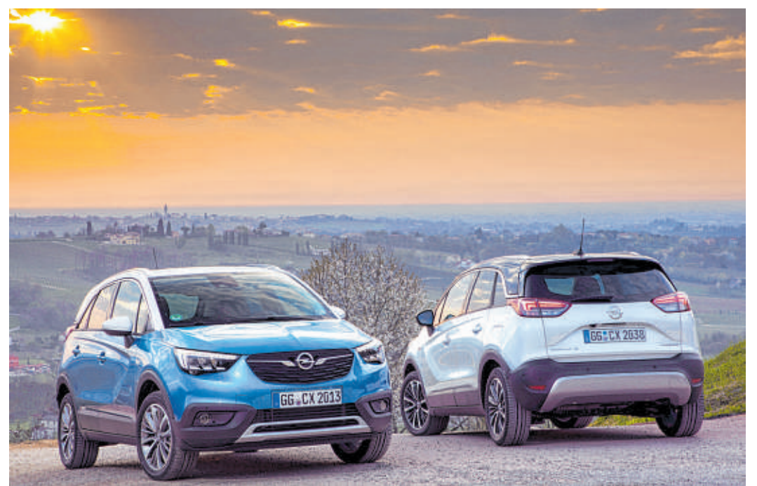
Der SUV-Boom bescherte Opel nun die besten Verkaufszahlen der vergangenen zehn Jahre. Ganz vorn dabei sind der Crossland X (Foto), der Mokka X und der Grandland X.

Der Newcomer bietet Top-Innovationen, die den Alltag sicherer, angenehmer und ein-