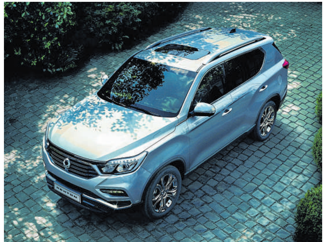
SsangYong stemmt sich mit dem neuen Rexton gegen den Trend Richtung Kompakt-SUV und bietet einen robusten, riesengroßen Offroader mit hohem Nutzwert zum günstigen Preis

Die vier Außenkameras garantieren dem Fahrer volle Rundumsicht, so sind die Lenk- und Einparkmanöver kinderleicht und sicher. Zur Erleichterung beim Parken werden beim Fahren nach hinten die Außenspiegel automatisch nach unten gesenkt. Bereits die Einstiegsversion