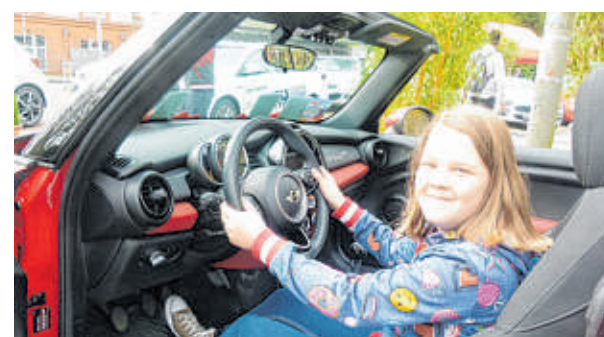
Auf dem bz-Automarkt kann auch der Nachwuchs mal probesitzen und den Eltern den einen oder anderen Hinweis geben, welches ihr Wunschfahrzeug wäre.