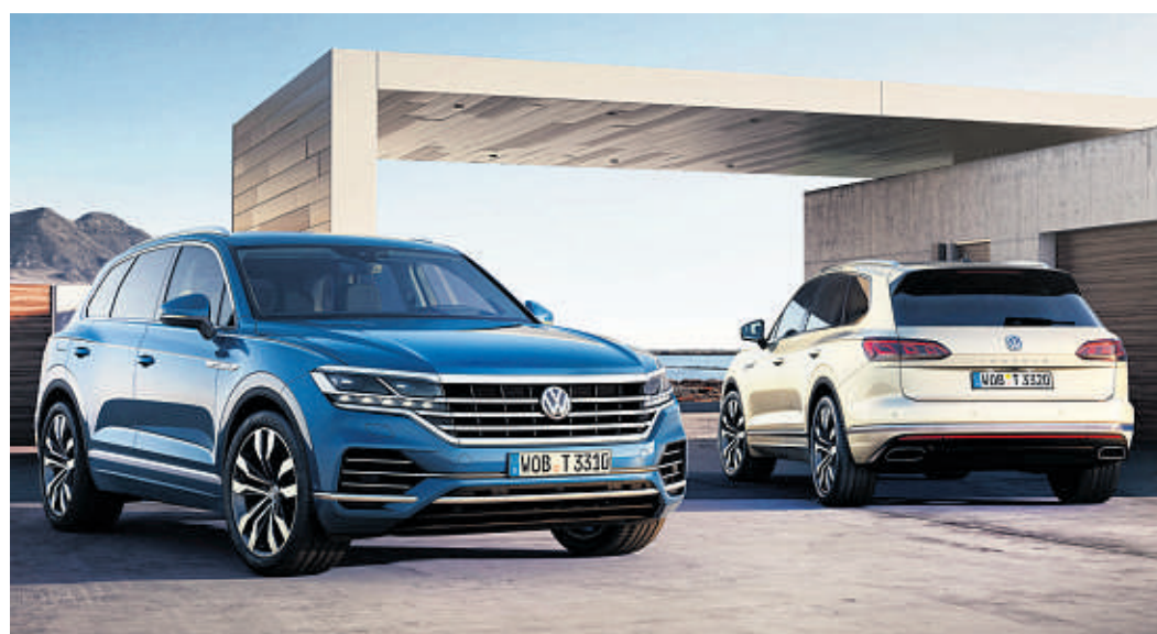
Der Touareg hat sich weltweit nahezu eine Million Mal verkauft. Die neue, dritte Generation des Premium-SUV soll diese Erfolgsgeschichte weiterschreiben.

Der Touareg startet mit dem größten Spektrum an Assistenz-, Fahrdynamik- und Komfortsystemen, das jemals in einen VW integriert wurde. Dazu gehören die Nachtsichtunterstützung (erkennt per Wärmebildkamera Personen und Tiere in der Dunkelheit),