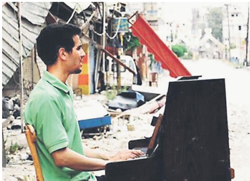
Der syrisch-palästinensische Pianist Aeham Ahmad spielt in Yarmouk, einem Flüchtlingslager in Damaskus.

vieren und in Bilder umzusetzen. Beruflich ist er für viele Magazine und Zeitungen auf der ganzen Erde als Fotograf unterwegs. Die Ausstellung im Elbschiffahrtsmuseum, Elbstraße 59, ist noch bis zum 18. Mai zu sehen.