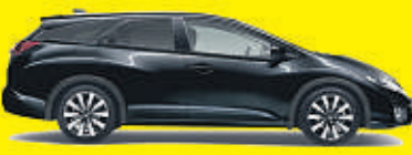
Abb. zeigt Sonderausstattung.

€ 8.000,- sparen gegenüber UPE € 33.900 inkl. Fracht