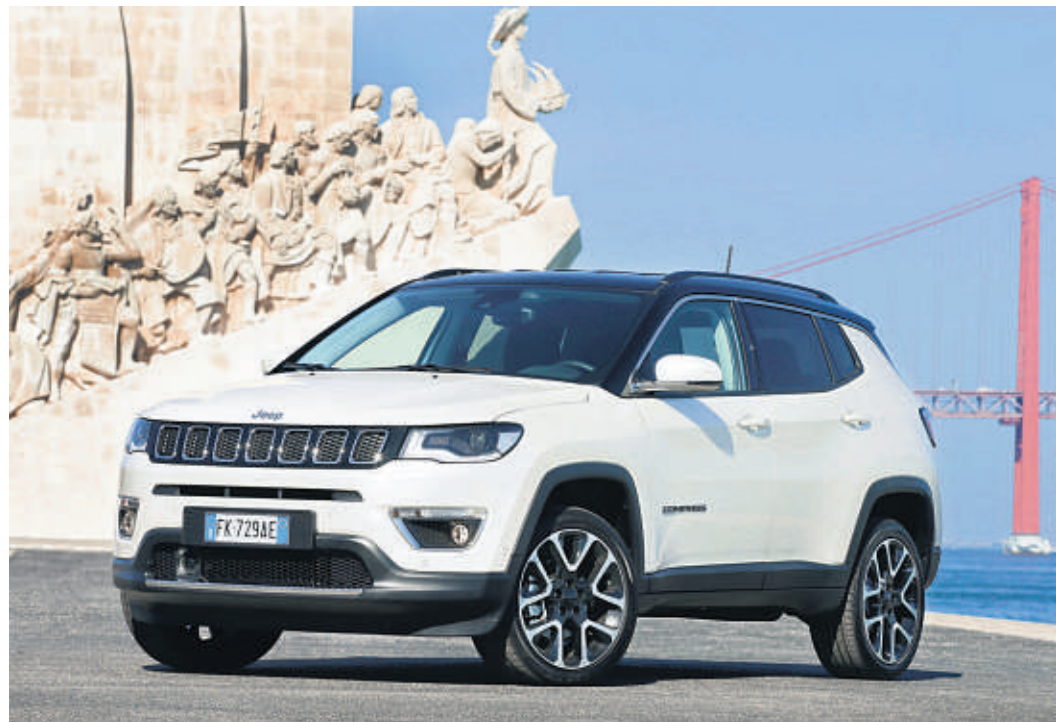
Der Markenname ist für viele noch immer ein Synonym für den Geländewagen schlechthin: Der Jeep Compass – hier in der Ausstattung „Limited“ – punktet mit ausgezeichneter Fahrdynamik.

Sicherheit für Fahrer und Passagiere garantieren mehr als 70 verfügbare, aktive und passive Sicherheits- und Schutzfunktionen wie etwa Auffahrwarnsystem, Spurhalte-Assistent (beides immer serienmäßig) sowie auf Wunsch Totwinkelwarner und hintere Querbewegungserkennung, ParkView Rückfahrkamera, ESP mit elektronischer Überschlusssvermeidung und sieben serienmäßige Airbags. Der Sicherheitskäfig des neuen Compass besteht zu über 65% aus hochfesten Stählen.