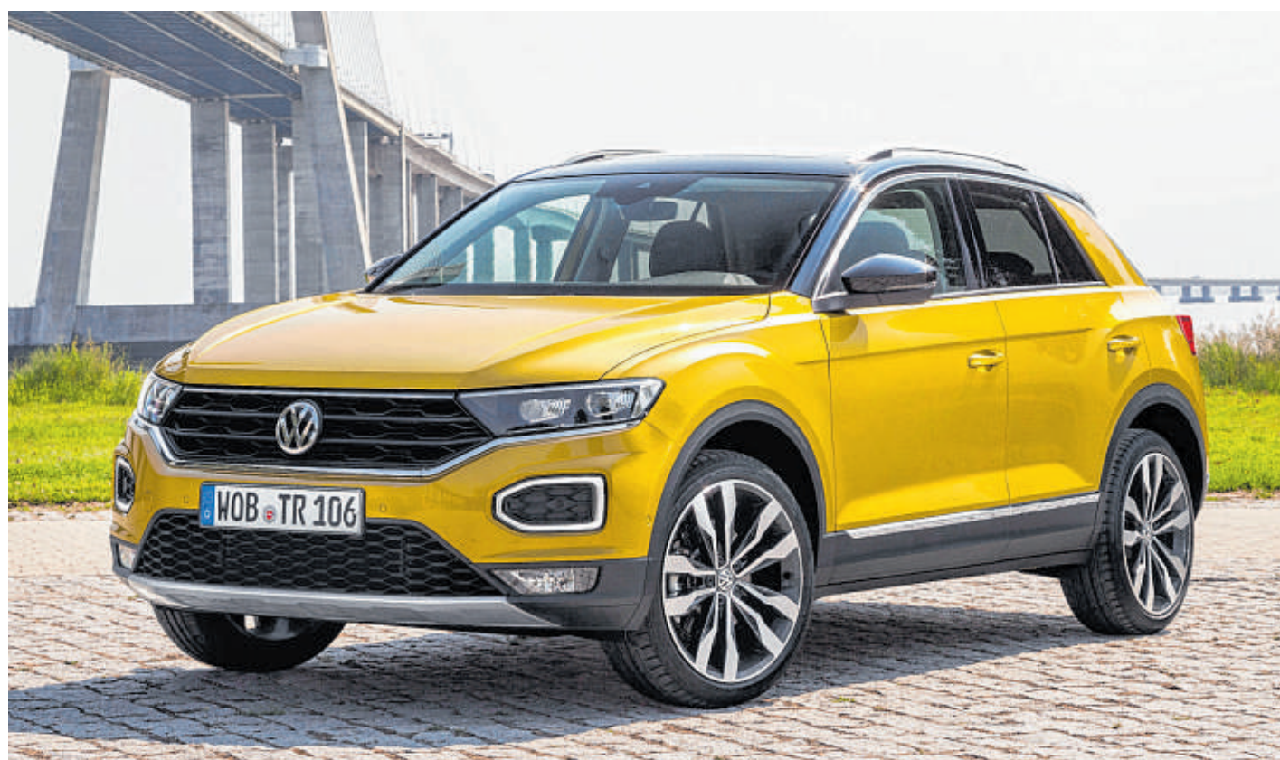
Mit dem 4,23 Meter langen T-Roc und einer eigens dafür kreierte Baureihe geht Volkswagen neue Wege.