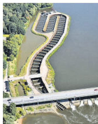
An der Fischaufstiegsanlage bei Geesthacht werden von April bis Oktober wieder Führungen angeboten.

Geesthacht (pl). Europas größte Fischaufstiegsanlage kann jetzt wieder besichtigt werden. Besucher erfahren bei einem circa 90-minütigen Rundgang Wissenswertes über die Anlage bei Geesthacht und die Artenvielfalt der Elbfische. Mehr als zwei Millionen Fische haben den Doppelschlitzpass seit seiner Einweihung im August 2010 durchschwommen, darunter Exoten wie Streifenbarsch, Sternhausen und Sibirischer Stör. Der schwerste und längste Fisch war ein 31,5 Kilo schwerer Wels mit einer Länge von 1,70 Meter. Bis Oktober werden die kostenlosen Führungen angeboten: jeden Mittwoch um 10, 12 und 14 Uhr sowie samstags am 21. April, 26. Mai, 23. Juni, 7. Juli, 25. August, 22. September und 20. Oktober. Um Anmeldung wird gebeten unter Tel. 040/570 11 32 00 oder per E-Mail an: fischaufstieg@vattenfall.de