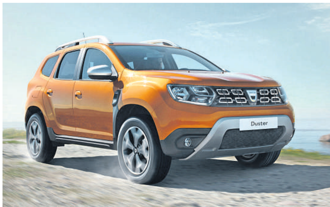
Die Kunden haben beim neuen Dacia Duster die Wahl zwischen fünf Motorisierungen sowie Front- und Allradantrieb.

Details wie der weit nach oben gezogene Unterfahrschutz – in der Topausstattung Prestige in Silber – verleihen dem neuen Modell nochmals mehr Präsenz und sorgen für robuste Geländewagenoptik.