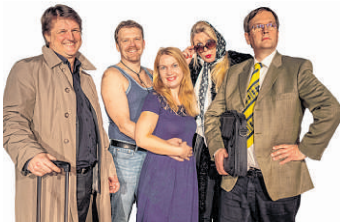
Traute Brümmer und ihr halbseidener Verlobter Siggie Bock kassieren immer noch Onkel Hermanns Rente, obwohl sie überzeugt sind, dass der verschwundene Onkel längst tot ist.

Zuvor ist das Lustspiel am Mittwoch, 25. April, um 19.30 Uhr sowie am Donnerstag, 26. April, um 15.30 und 19.30 Uhr im Bergedorfer Theater Haus im Park, Gräpelweg 8, zu sehen. Karten zu 12, ermäßigt 10 Euro gibt es im Vorverkauf beim Ticketshop der Bergedorfer Zeitung im City Center Bergedorf, Tel. 040/720 04258, E-Mail: ccb@funke-ticket.de oder im Internet oder direkt an der Abendkasse.