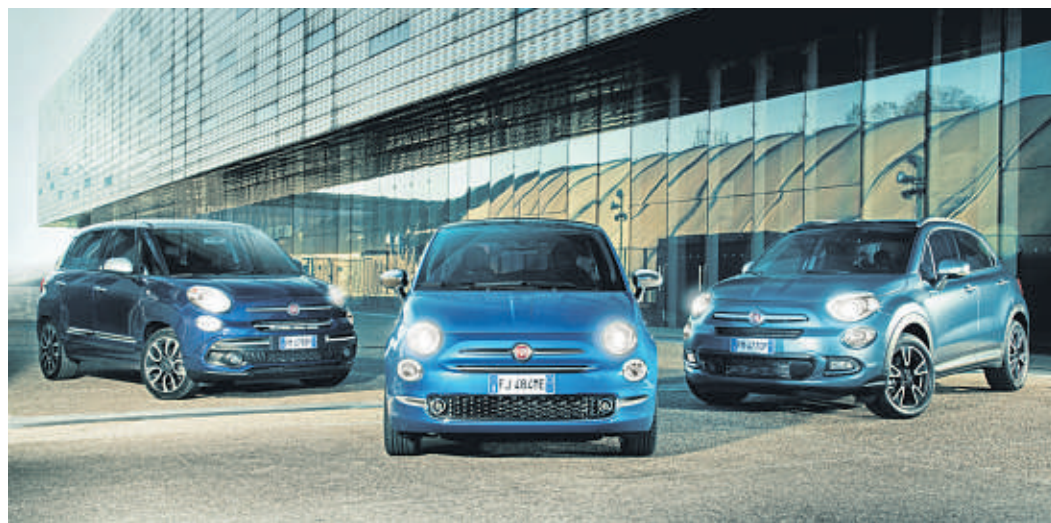
Eine vielseitige Familie (v.l.): die Mini-Limousine 500L, der Klassiker Fiat 500 und das kleine SUV 500X. Jedes Modell ist nochmals in unterschiedlichen Versionen erhältlich, zum Beispiel der 500 als Cabrio, der 500L als kompakter Van und der 500X im Cross-Look.

Drei Modellvarianten stehen dem geeigneten Käufer zur Auswahl: das kleine Stadtauto Fiat 500, die Mini-Limousine Fiat 500L und das kompakte SUV Fiat 500X. Neben modernen, umweltfreundlichen Motoren und einer umfangreichen Serienausstattung – schon in der Basisversion „Pop“ hat der Fiat 500 u.a. sieben Airbags, Tagfahrlicht in LED-Technik, Klimaanlage, das Multimediale Uconnect, elektrisch verstellbare Außenspiegel, elektrische