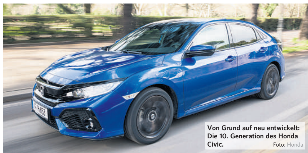
Von Grund auf neu entwickelt: Die 10. Generation des Honda Civic.

Honda Civic erfüllt die Abgasnorm Euro-6d-Temp – ohne AdBlue-System