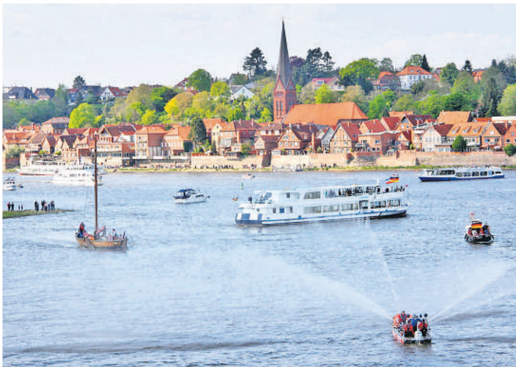
Der Kurs Elbe. Tag ist ein Projekt im Rahmen des Kooperationsprojekts „Kurs Elbe. Hamburg bis Wittenberge“.

Auch in der Lauenburger Altstadt erwartet die Gäste ein abwechslungsreiches Programm mit Kunsthandwerkermesse, einer Waffenschau der Lüneburger Stadtwache, Führungen im Elbschiffahrtsmuseum, in der Hitzler-Werft und durch die historischen Gassen der Altstadt. Auch die kleinen Besucher kommen auf ihre Kosten mit Piraten-Lager und einem Kinderatelier. Kleine Forscher können das Elbwasser untersuchen. An einer anderen Station werden Schiffe gebastelt. Um nichts zu verpassen, gibt es einen Schiffs-