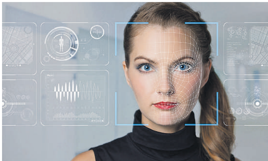
Die Vermessung der Belegschaft: Schon heute können Personaler die gesammelten Daten sogenannter „sozialer Graphen“ zur Entscheidungsfindung einsetzen.

Durch elektronische Kommunikation fallen in Unternehmen immer mehr Daten an, die Interaktionen unter Beschäftigten dokumentieren. Technisch ist es für Arbeitgeber bereits möglich, daraus soziale Beziehungsgeflechte oder „soziale Graphen“ der Belegschaft zu konstruieren und für Personalentscheidungen einzusetzen, zeigt eine aktuelle, von der Hans-Böckler-Stiftung geförderte Studie.