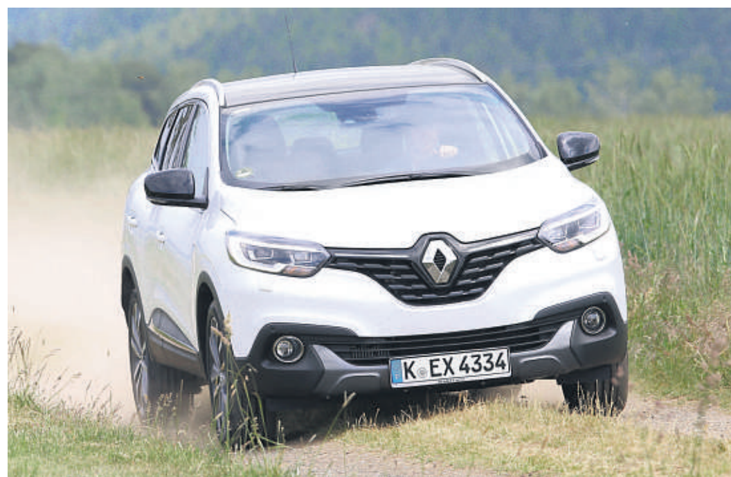
Mit seinen athletischen Formen, seiner erhöhten Bodenfreiheit, den Front- und Heckschürzen in SUV-Look sowie dem optional erhältlichen variablen Allradantrieb verkörpert der Renault Kadjar wie kein Zweiter den SUV-Spirit.

Für die Motorisierung Energy dCi 130 steht der variable Allradantrieb All Motion 4x4-I zur Verfügung. Per Drehknopf kann der Fahrer hierbei zwischen drei Antriebsarten wählen. Im Auto-Modus fährt der Kadjar 4x4 kraftstoffsparend mit Frontantrieb. Erst wenn die Traktion nachlässt, werden bis zu 50 Prozent des Drehmoments vollautomatisch an die Hinter-