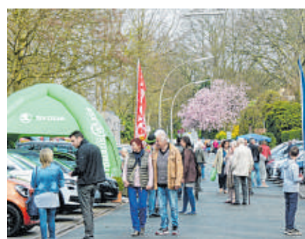
Nur wenige Schritte vom Sachsentor entfernt beginnt am kommenden Wochenende die große Automeile.

Öffnungszeiten: Samstag von 10 bis 18 Uhr, Sonntag von 10 bis 17 Uhr.