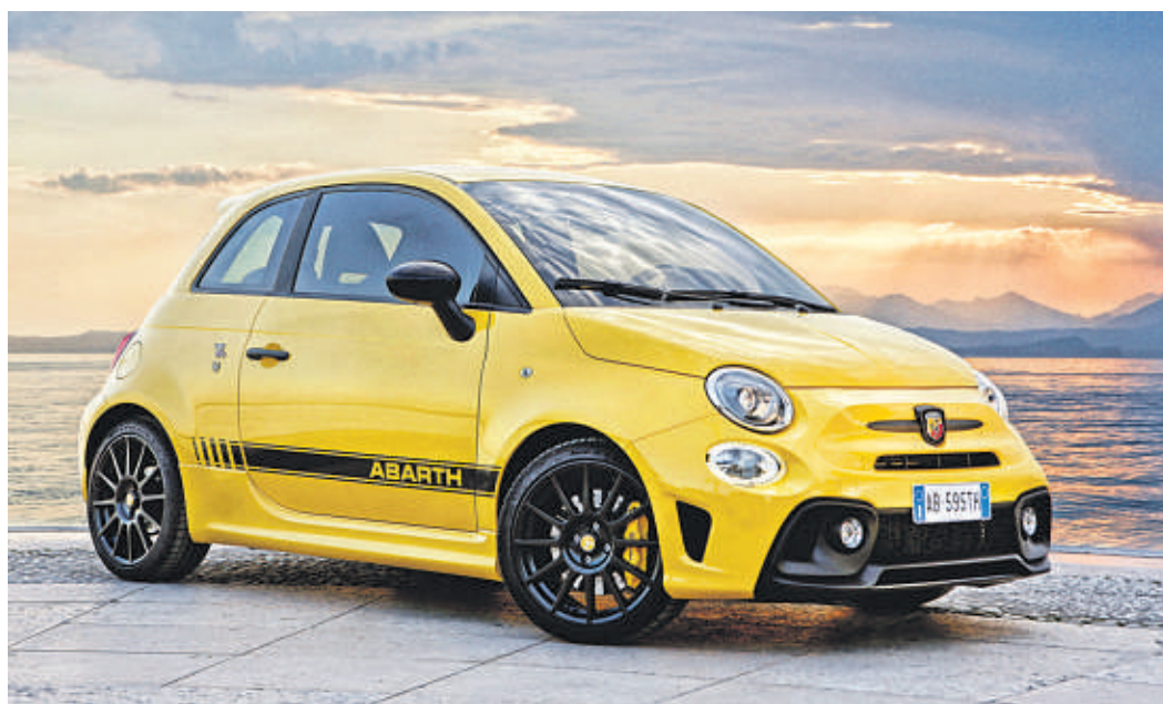
„Rennknubbel“: Der Abarth 595, der 595 Turismo und der 595 Competizione bringen das Abarth-Rennsportgen mit modernster Technik und perfekter Abstimmung auf die Straße.

Schließlich ist der Fahrer eines Abarth besonders anspruchsvoll und darf das auch sein. Deshalb kann er sich auf viele Detail-Verbesserungen freuen, die unmittelbar aus dem Abarth-Rennsport, genauer vom äußerst erfolgreichen 695 Biposto, abgeleitet wurden.