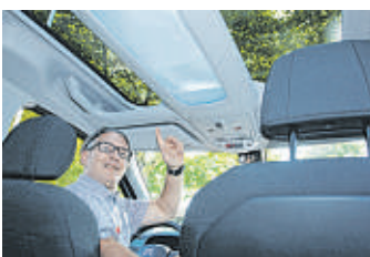
Das Panorama-Glasdach ist ein weiteres Highlight des neuen Citroën Berlingo.