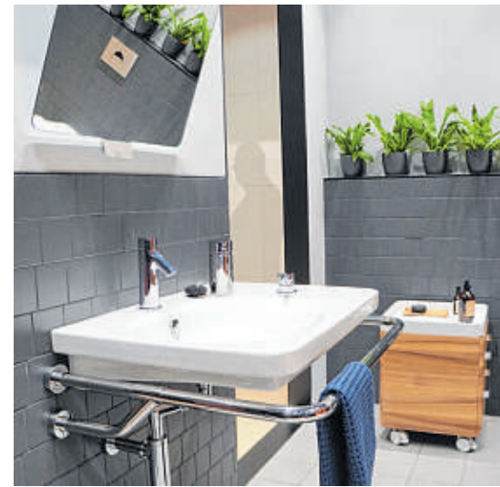
Sicherheit rund ums Waschbecken: Der Handtuchhalter mit einer stabilen Befestigung in der Wand dient auch zum Festhalten und Abstützen.

Oft ist heute vom „Generationenbad“ die Rede: Badkomfort für den Benutzer „in den besten Jahren“ bis ins hohe Alter. So ein barrierearmes Bad vermeidet Stolperfallen und Barrieren der Erreichbarkeit wie etwa ungünstig platzierte Schränke und Ablagen. Es bietet vordergründig eine bodenebene Dusche. Eine Investition, die von der Kreditanstalt für Wiederaufbau (KfW) und den Pflegekassen bezuschusst werden kann.