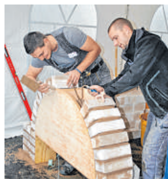
Mauern will gelernt sein. Wer selbst einmal einen Stein exakt setzen will, probiert es am „Tag des Handwerks“ aus.

Spiel und Spaß für Kinder und Gewinnspiele mit vielen Preisen runden das Programm ab. Als Hauptpreis winkt ein iPad, gestiftet vom Versorgungswerk der Kreishandwerkerschaft.