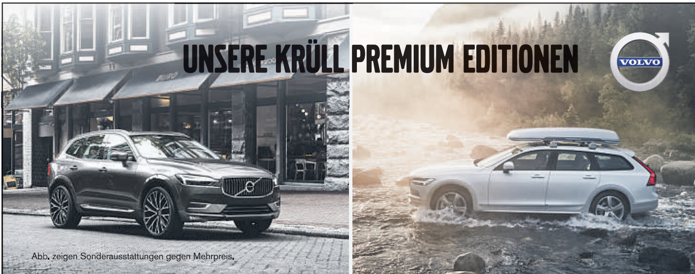
Abb. zeigen Sonderausstattungen gegen Mehrpreis.

VOLVO XC60 D4 2 AUTOMATIK | LEDERKOMFORTSITZE | SITZHEIZUNG VORN | SENSUS NAVI | 9"-TOUCHSCREEN | APPLE CARPLAY™ | FREISPRECHEINR. | AUDIO-STREAMING | EINPARKHILFE VO + HI | LM-RÄDER | LED-SCHWEINWERFER „THORS HAMMER“ | KLIMAAUTOMATIK | NOTBREMSASSISTENT | VERKEHRSZEICHENERKENNUNG | SPURHALTEASSISTENT | UVM