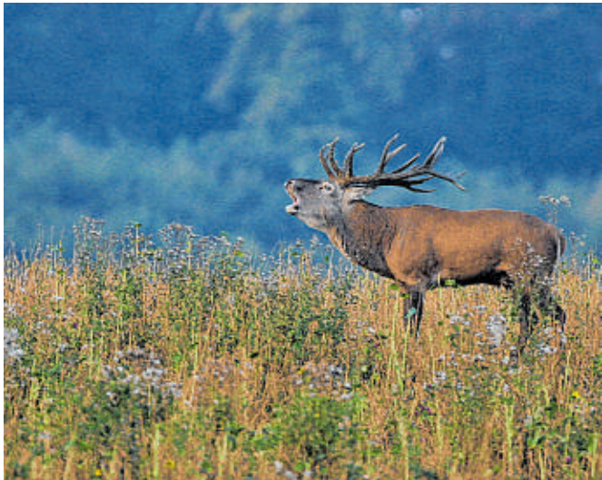
Ein Naturschauspiel der besonderen Art dürfen die Teilnehmer der Exkursion am Samstag erwarten.

Parkplatz am Bahnhof in Pritzler (PLZ 19230). Von dort geht es in Fahrgemeinschaften oder eigenem Pkw zum Startpunkt der abendlichen Exkursion, die mit dem Revierinhaber abgestimmt ist. Neben Fernglas, Taschenlampe und einem Hocker oder Campingstuhl werden wetterfeste, dunkle Kleidung sowie festes Schuhwerk empfohlen. Die bis ca. 19.30 Uhr dauernde Exkursion ist kostenfrei, jedoch wird um eine kleine Spende für die Bildungsarbeit des Biosphärenreservatsamtes gebeten. Eine Anmeldung ist bis spätestens 14. September erforderlich, da die Teilnehmerzahl beschränkt ist. Weitere Infos unter Tel. 038851 3020 oder: elbetal-mv.de