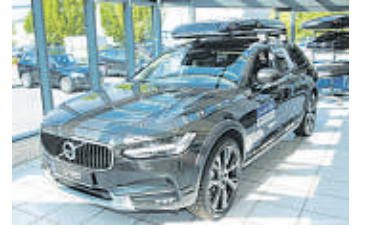
Der neue Volvo V90 ist ein echt edler Business-Kombi.

Der neue Volvo V90 ist ein echt edler Business-Kombi. Und in der Version Cross Country ist er zudem robust und anspruchsvoll