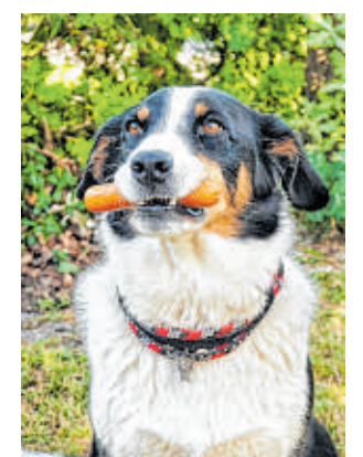
Am Wochenende verwandelt sich Schloss Wotersen wieder zu einem Treffpunkt für Hundefreunde.