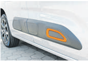
Die Airbumps bieten Schutz gegen die kleinen Rempler des Alltags.