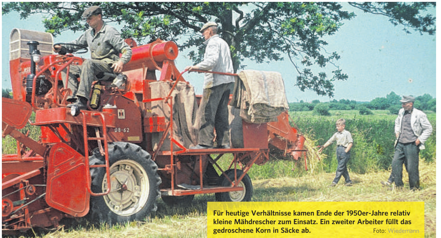
Für heutige Verhältnisse kamen Ende der 1950er-Jahre relativ kleine Mähdrescher zum Einsatz. Ein zweiter Arbeiter füllt das gedroschene Korn in Säcke ab.