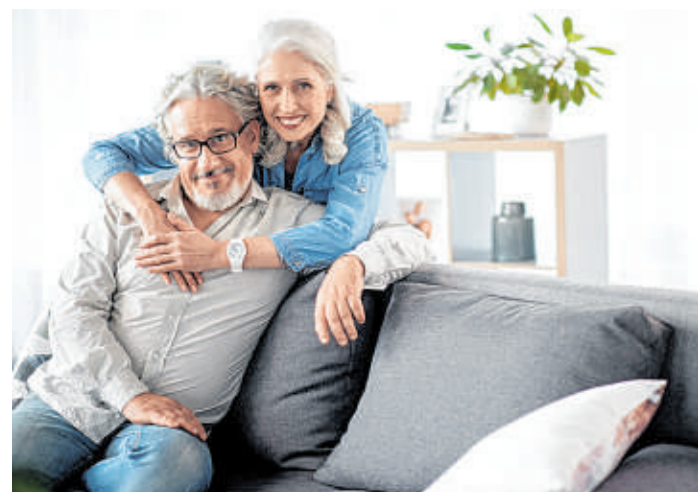
Kleine, enge Zimmerschnitte? Von wegen, auch Senioren lieben komfortable Wohnungen mit viel Platz.

Wer Interesse an diesem neuen Projekt in traumhafter Lage hat, kann sich am Sonntag, 16. September, von 11 bis 14 Uhr direkt vor Ort in Geesthacht an der Steinstraße 11-16 umfassend zu den Immobilien und den möglichen Serviceangeboten informieren.