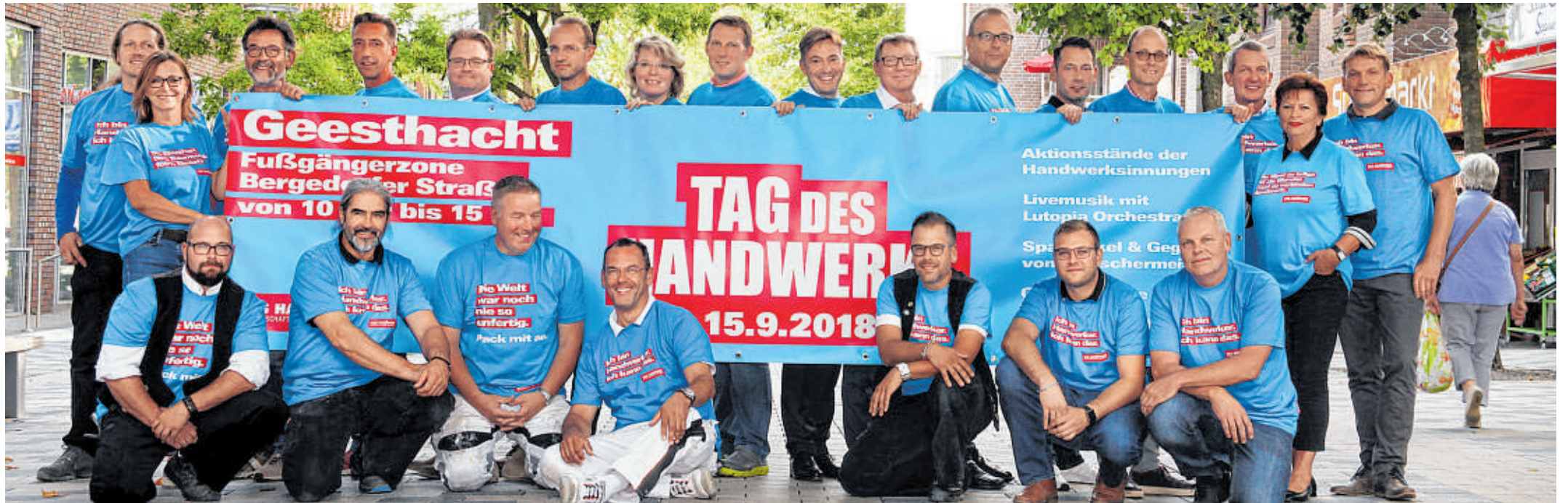
Vereint und gut gelaunt für einen großen Tag: Am Samstag laden die Handwerker wieder von 10 bis 15 Uhr zum „Tag des Handwerks“ in die Geesthachter Fußgängerzone ein.

Tag des Handwerks Mitmach-Aktionen, freie Lehrstellen, Kundenberatung, Digitalisierung, Gewinnspiele