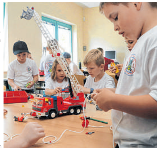
Die „Löschwölfe“ nähern sich dem Thema „Feuerwehr“ auch spielerisch: Die für Kinder geeigneten Utensilien hat die Kreissparkasse der Kinderabteilung zur Verfügung gestellt.