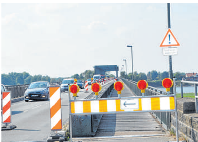
Zwischen Mittwoch und Sonntag war der Fuß- und Gehweg der Lauenburger Elbbrücke gesperrt. Kilometerlange Staus auf beiden Seiten der Elbe waren die Folge.