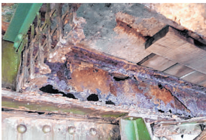
Nähte gerissen, reichlich Rost und große Bauteile durchlöchert wie ein Schweizer Käse, dazu Holzbohlen. Lauenburgs Elbbrücke macht aktuell von unten einen wenig vertrauenserweckenden Eindruck.

„Wir haben ein Unternehmen gefunden, das den betroffenen Bereich durch ein freitragendes Gerüst stabilisiert. Daher konnten wir die Einschränkungen am Sonntag aufheben“, erklärt Lüth. Der Unterbau der Fahrbahn sei nicht betroffen, die Statik der Brücke in ihrer Gesamtheit aktuell nicht gefährdet.