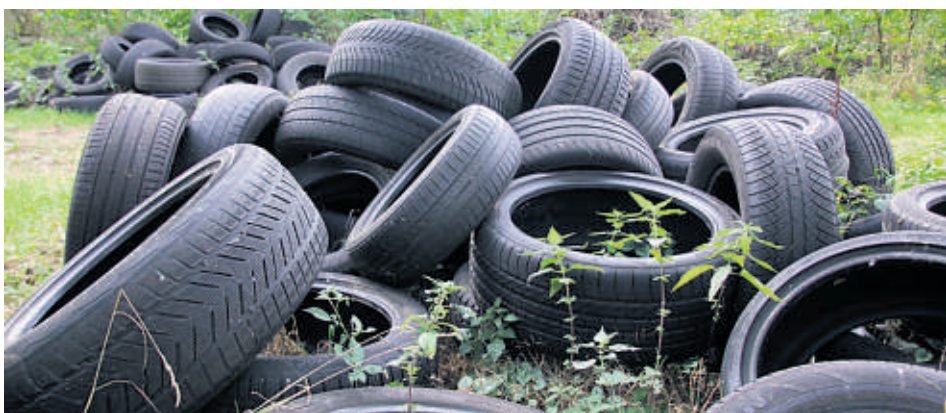
Michelin, Hankook oder Continental: Reifen unterschiedlicher Marken wurden im Wald abgelegt.

Geesthacht (rpf). Müllräger bei Grünhof-Tesperhude: Unbekannte haben in einem Waldstück offenbar illegal Reifen im großen Stil entsorgt. Die Geesthachter Polizei geht von 80 Pneus aus, die am Ziegeleweg (Richtung Neu Gülzow) nur knapp 200 Meter hinter der Bundesstraße 5 an der