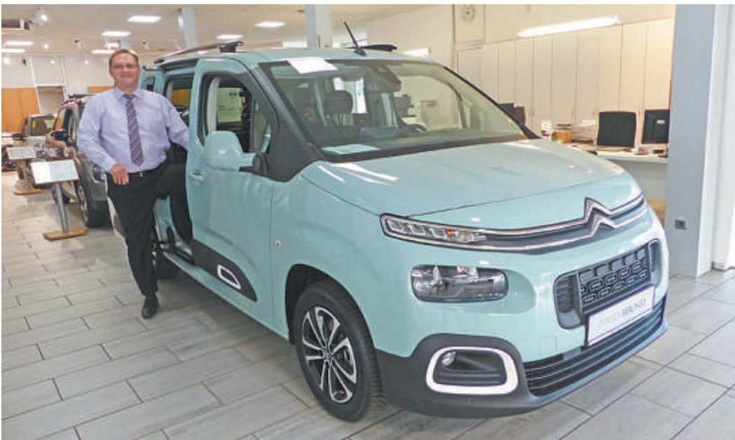
Der Citroën-Experte Markus Stubbe bei Krüll am Curslacke Neuer Deich 2-14 präsentiert den neuen Citroën Berlingo.

Kraftstoffverbrauch Volvo XC60 D4 AWD (in l/100 km): innerorts/außerorts/kombiniert: 5,8/4,6/5,1; CO 2 -Emission (g/km): kombiniert 133.