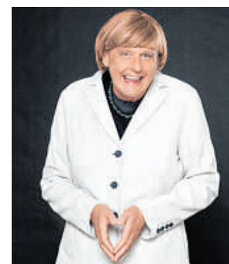
Natürlich wird auch „Muddi Merkel“ in Reiner Kröhnerts Parodistenparade auftauchen.

Tote Tyrannen treffen auf lebende Legenden. Und wenn