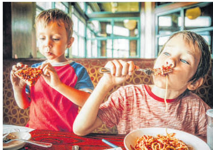
Welche Tischmanieren Kinder haben, liegt letztendlich am Erziehungsstil der Eltern.