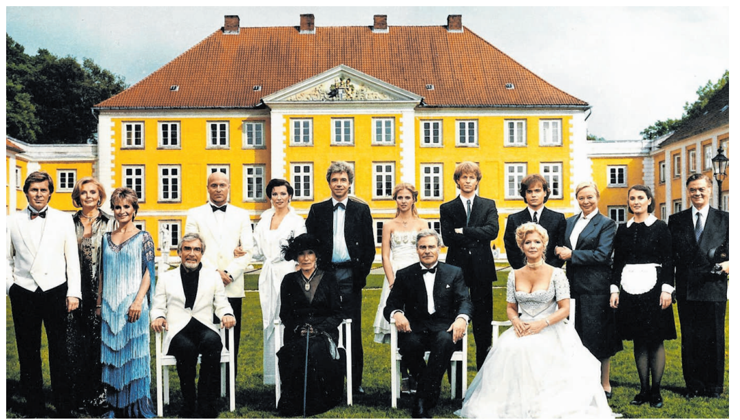
Dreharbeiten für die Guldenburgs auf Schloss Wotersen im Jahr 1987 (v. l.): Jan Balbeck (Sigmar Solbach), Margot Balbeck (Ruth Maria Kubitschek), Kitty Balbeck (Susanne Uhlen), Dr. Max Graf von Guldenburg (Jürgen Goslar), Achim Lauritzen (Wilfried Baasner), Evelyn von Guldenburg (Iris Berben), Hertha Gräfin von Guldenburg (Brigitte Horney), Thomas Graf von Guldenburg (Wolf Roth), Susanne Komtess von Guldenburg (Katharina Böhm), Martin Graf von Guldenburg (Karl-Heinz Vosgerau), Alexander „Sascha“ Graf von Guldenburg (Jochen Horst), Tobias Kröger (Alexander Wussow), Christine Gräfin von Guldenburg (Christiane Hörbiger), Johanna Kröger (Ingeborg Christiansen), Kurt Kröger (Friedrich Schütter).