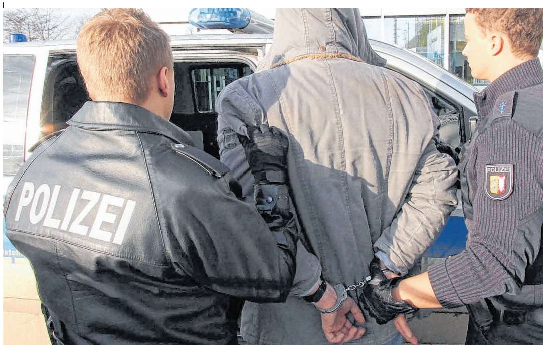
Die Polizei in Lauenburg bearbeitete 2016 insgesamt 1004 Straftaten. Spurensicherungen führten zu Festnahmen.

Lauenburg (er). Die Mitglieder Deutschen Lebensrettungs-Gesellschaft (DLRG) treffen sich am Freitag, 3. März, zur Jahresversammlung. Auf der Tagesordnung steht neben Wahlen und Berichten – die Ehrung verdienter langjähriger Mitglieder. Die Versammlung beginnt um 19 Uhr in der DLRG-Fahrzeughalle, Lüttau Chaussee 24.