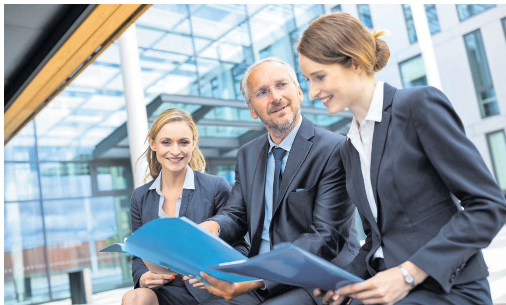
Ein Businessplan ist der erste Schritt in die Selbstständigkeit, zumindest wenn man Geldgeber von seinen Ideen überzeugen will.