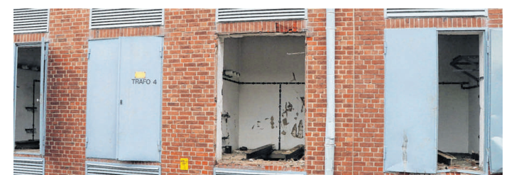
So wüteten die Metalldiebe: Aus diesen Fächern wurden Transformatoren der ehemaligen Teppichfabrik entwendet.