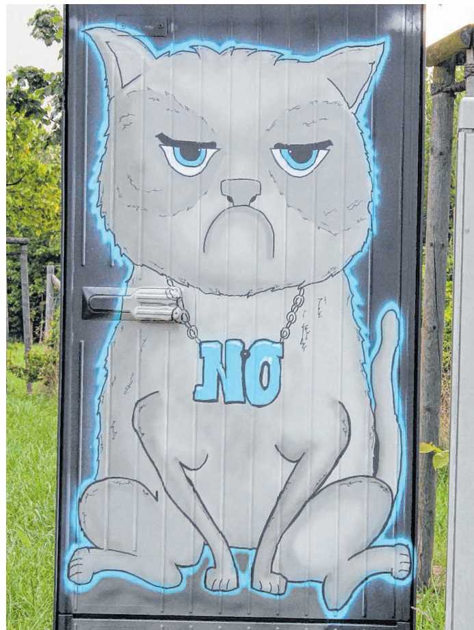
Ein bemalter Stromkasten in Geesthacht. Schon bald könnte es so oder ähnlich auch auf Lauenburger Kästen aussehen.

Anfang Juli sollen die ausgewählten Motive feststehen und prämiert werden. Gut zu wissen für die Künstler: Die Motive verschönern künftig nicht nur die Lauenburger und Boizenburger Stromkästen, sondern werden auch in einem Bildband veröffentlicht.