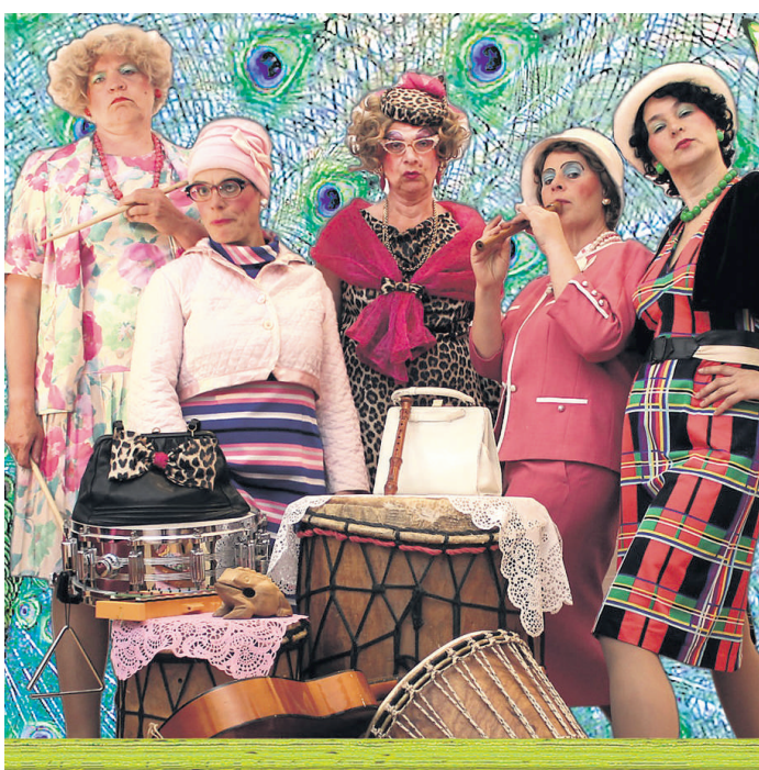
Diese fünf Hamburger Deerns haben ihre Kochtöpfe gegen Trommeln getauscht und träumen als „Trude“ von westafrikanischen Rhythmen.

Einige Restkarten für das kultige Konzertereignis sind noch verfügbar. Diese gibt's zum Preis von 18 Euro im Mosaik (Tel. 0 41 53/52 31 0), im Reisebüro Oberelbe (T. 30 61), in der Buchhandlung Rusch (T. 24 35) und in der Tourist-Info (T. 59 09 220) sowie in Geesthacht bei Zigarren Fries (Tel. 0 41 52/33 72) und in Schwarzenbek im Tabakshop Lange (Tel. 0 41 51/8 12 40).