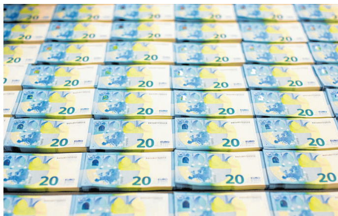
Millionenabfindungen und exorbitante Gehälter: Die Politik streitet sich gerade darüber, ob Managervergütungen begrenzt oder ob das Aktionärsrecht geändert werden soll.