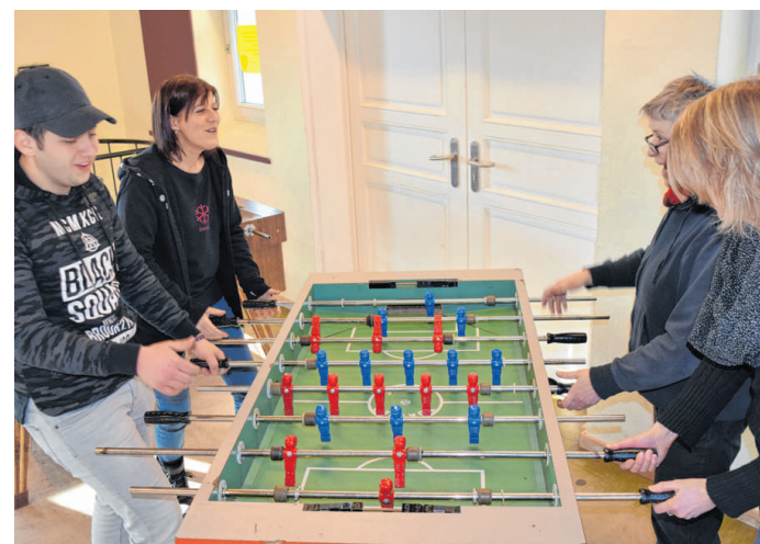
Tischfußball ist sehr beliebt im JuZ; wenn mal nicht genug Spieler da sind, springen Mitarbeiterinnen ein.

Das Jugendzentrum Alter Bahnhof hat montags bis donnerstags von 14 bis 20 Uhr geöffnet, freitags bis 18 Uhr. Einmal im Monat wird auch sonntags von 14 bis 18 Uhr geöffnet. Erster Termin: 4. März.