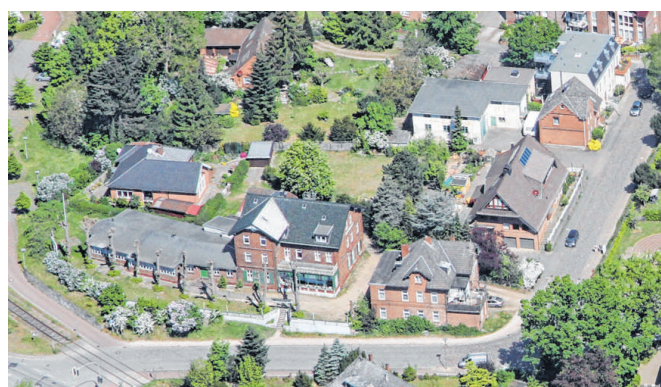
Um diese Fläche geht es: Das Haus für Teenie-Mütter ist auf dem dreieckigen Grundstück hinterm Hotel Zur Post geplant. Bewohner der Hafenstraße (rechts) kritisieren das.

Schockiert über die Nachricht zeigten sich zwei Anwohner, die in einem Haus an der Hafenstraße wohnen, dessen Garten direkt an das Dreiecksgrundstück grenzt. Einer der Bewohner kritisierte