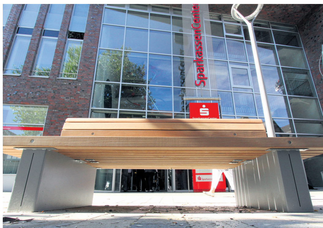
Die Sitzflächen der neuen Bänke in der Geesthachter Fußgängerzone sind aus tropischem Hartholz der Sorte Cumaru.