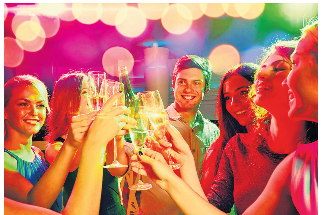
Gute Freunde, gute Drinks, gute Musik, gute Laune - das sind die wichtigsten Zutaten für die Lauenburger Kultur- und Kneipennacht.

Lauenburg (pl). Viel Livemusik, Poetry Slams, Malerei, Film, Tanz, Vorträge: Auch in der fünften Auflage hat die Lauenburger Kultur- und Kneipennacht wieder eine ganze Menge zu bieten. Insgesamt 25 Veranstaltungen in den unterschiedlichsten Lokalisationen warten am Samstag, 4. März, auf die Besucher - und die müssen dafür nur ein einziges Mal Eintritt zahlen.