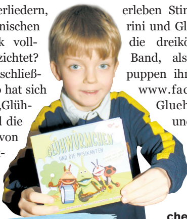
Justus ist jetzt ein Glühwürmchen-Fan

Auch in den sozialen Medien erleben Stinkekäfer, Marini und Glühwürmchen, die dreiköpfige Käferband, als Klappmaulpuppen ihre Abenteuer: www.facebook.com/GluehwurmchenunddieMusikanten (nik)