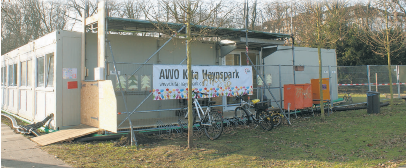
Auf der Fläche Loogestraße stehen derzeit Container für die Kita Haynsark. Bald auch für Geflüchtete?

Looge- und Hegestraße im Gespräch. Entscheidung steht aus